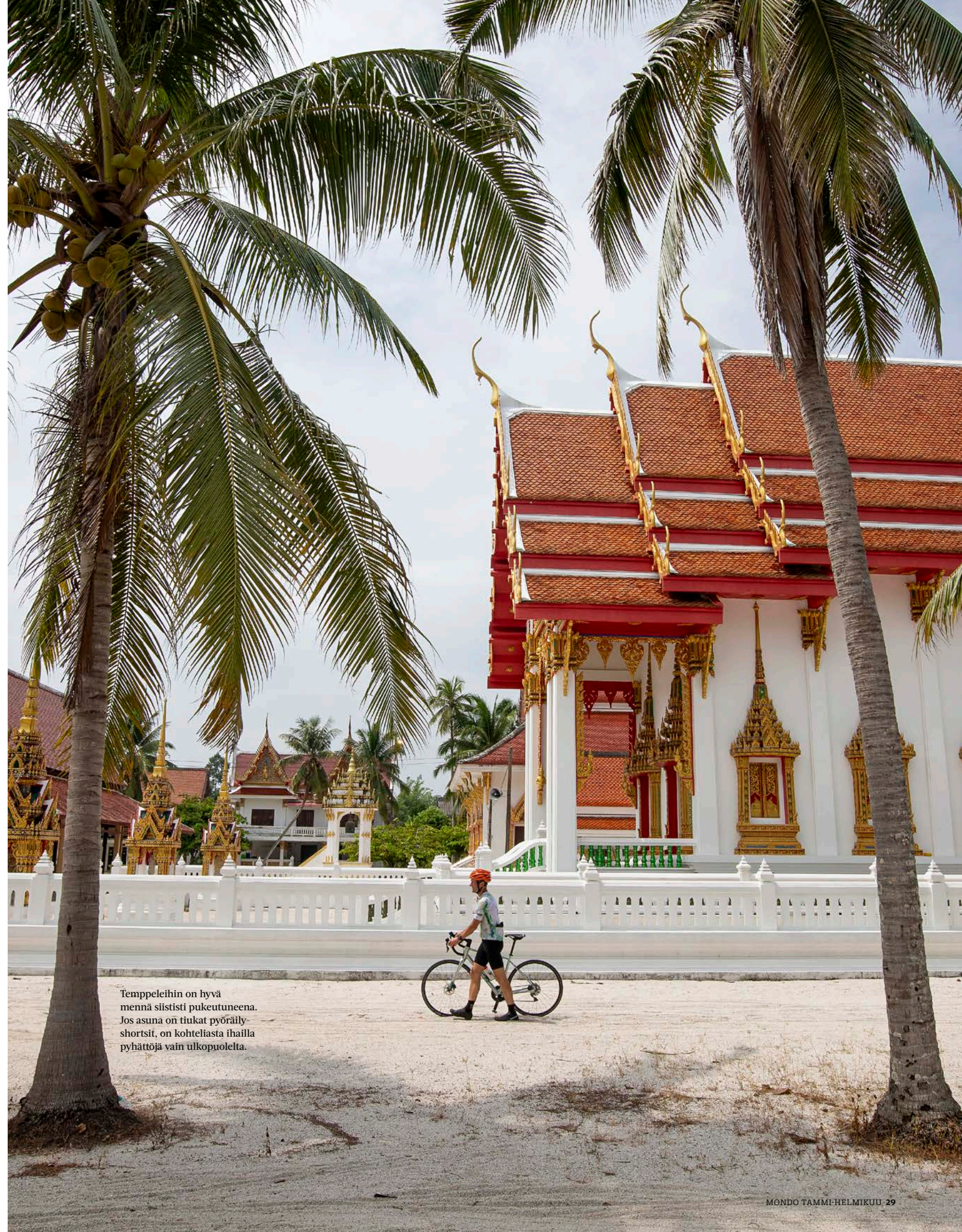
Temppeleihin on hyvä mennä siististi pukeutuneena. Jos asuna on tiukat pyöräilyshortsit, on kohteliasta ihailia pyhättöjä vain ulkopuolelta.

Istahdimme välipalalle kahvilaan. Nautimme kaikenlaisia perinteisiä riisistä ja tapiokajauhusta tehtyjä jälkiruokia.